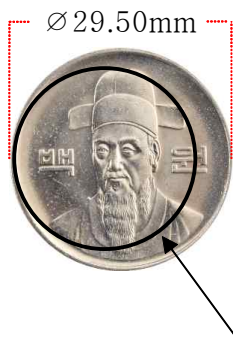
실제 주화 규격