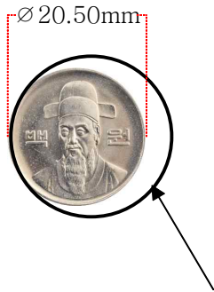
실제 주화 규격